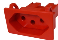
Tomadas para painel embutida sem rabicho