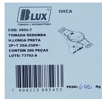
Antigo adesivo (imagem superior) novo adesivo (imagem inferior)