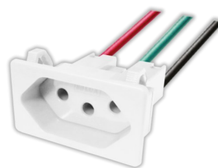
Tomada para painel embutida com rabicho

Estão disponíveis nas cores branca, preta e vermelha e possuem garantia de 15 anos.